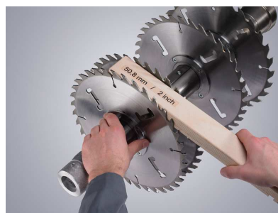
Minimální přestavovací časy díky systému Quickfix (bez mezikroužků, bez zajišťovacích matic)