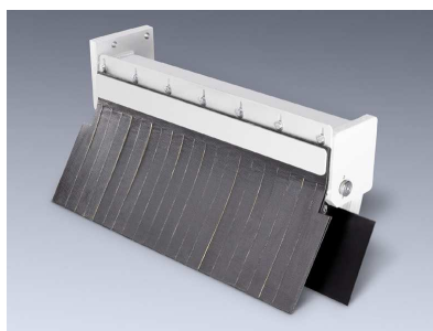
Maximální bezpečnost obsluhy díky výbavě SafetyPlus