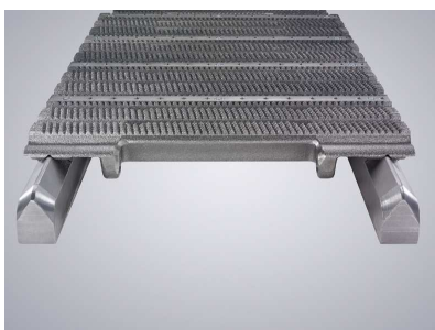
Prizmatické vedení řetězu pro přesný řez